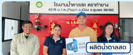
ผลิตน้ำตาลสด