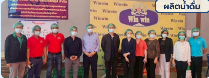
ผลิตน้ำดื่ม