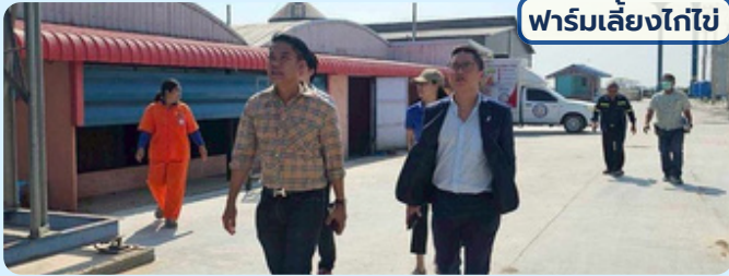
ฟาร์มเลี้ยงไก่ไข่