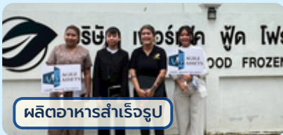
ผลิตอาหารสำเร็จรูป