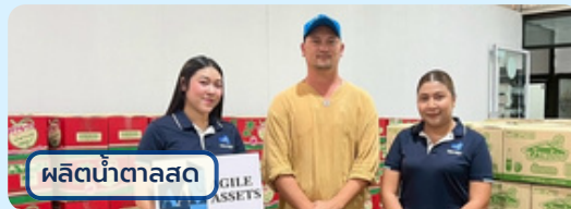
ผลิตน้ำตาลสด