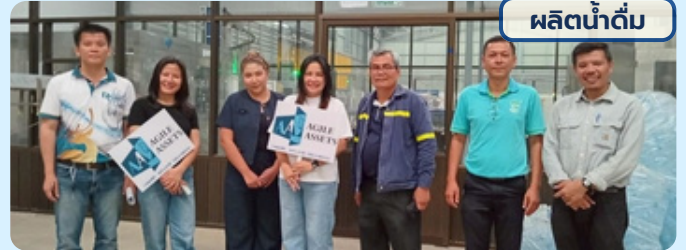
ผลิตน้ำดื่ม