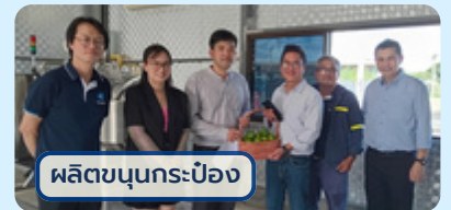
ผลิตขบุนกระป๋อง