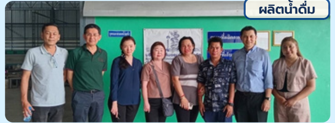
ผลิตน้ำดื่ม