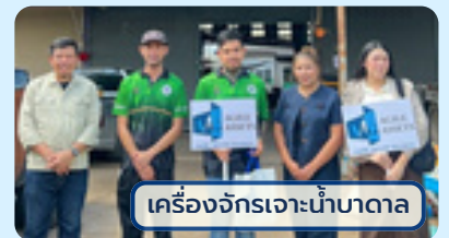
เครื่องจักรเจ้าน้ำบาดาล