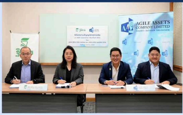
บรรยากาศการลงนามสัญญาร่วมมือทางธุรกิจ