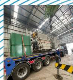
ส่งมอบเครื่องจักรและคู่มือเครื่องจักรให้กับบริษัทเอสซีไออีโคเซอร์วิส จำกัด